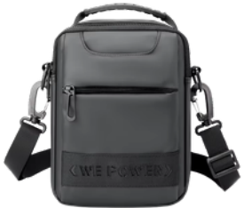
MORRAL D/HOMBRE BP1328