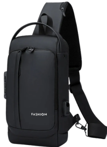
MORRAL D/ HOMBRE BP1334