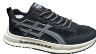
ZAPA. HOMBRE. BRAN. J83037