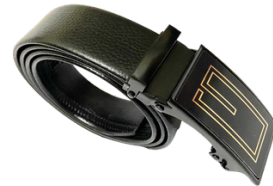
CORREA 4.004 KD- 2469DF