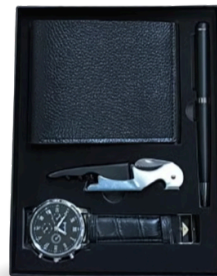
SET BILLETERA, RELOJ, LAPICERO Y DESTAPADOR