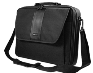
LAPTOP CASE KLIP XTREME