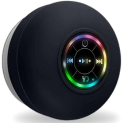
MINI AUDIO Y-43