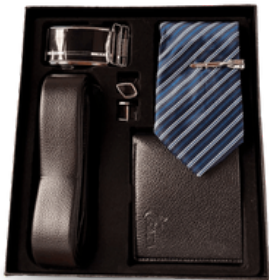
SET BILLETERA, CORBATA, GEMELOS Y CORREA